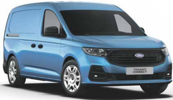
Boundless Blue metallic lak