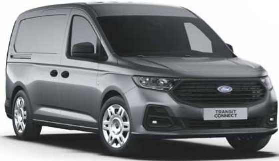
Graphite Grey metallic lak