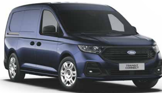
Midnight Blue metallic lak