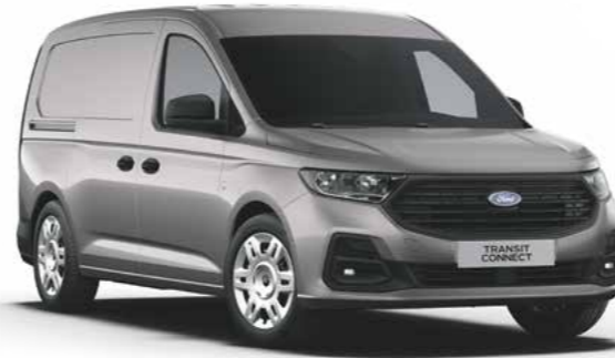
Dusky Silver metallic lak