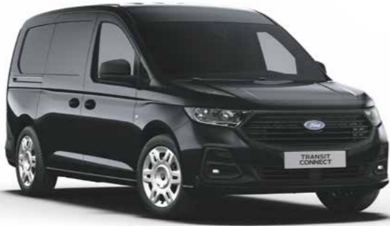
Ink Black metallic lak