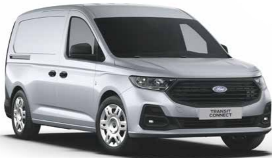
Stardust Silver metallic lak