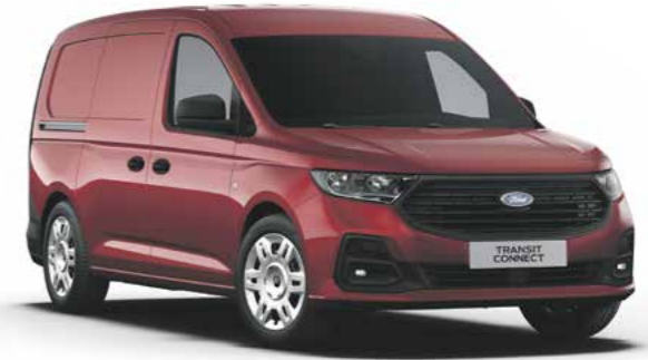
Maple Red metallic lak